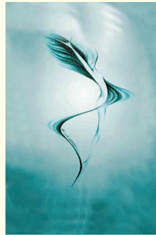
Enikő Sivák: Pápirka, 2005

Komorná výstava Enikő Sivák z Moldavy nad Bodvou (momentálne žije v Budapešti) pod